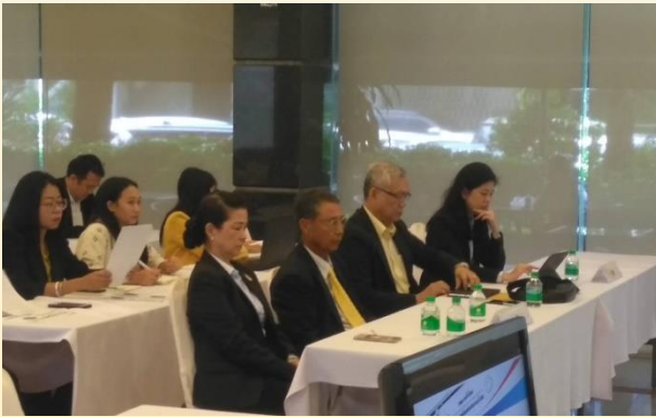
26 กรกฎาคม 2562 TTIA เข้าร่วมงานแถลงข่าว "ข้อเสนอของ การค้าไทยและสภาหอการค้าแห่งประเทศไทยต่อนโยบาย รัฐบาลในอัตราค่าจ้าง"