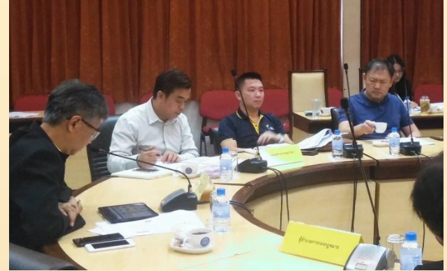
25 กรกฎาคม 2562 TTIA เข้าร่วมประชุม ชี้แจงขั้นตอนการ ปฏิบัติ ตามประกาศกรมประมง เรื่อง กำหนดหลักเกณฑ์วิธีการ และเงื่อนไขการขออนุญาตและการอนุญาตนำเข้า กรณีการ นำเข้าปลาทูน่าแช่แข็งบรรจุตู้คอนเทนเนอร์ที่มีการคัดแยกชนิด และปริมาณไม่ชัดเจน พ.ศ. 2562