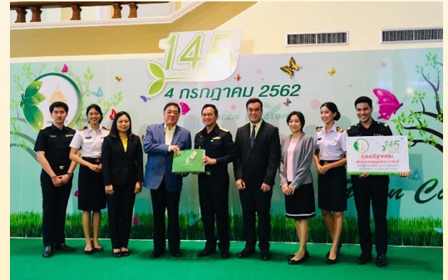
4 กรกฎาคม 2562 TTIA เข้าร่วมงานคล้ายวันสถาปนากรม ศุลกากรครบรอบ 145 ปี