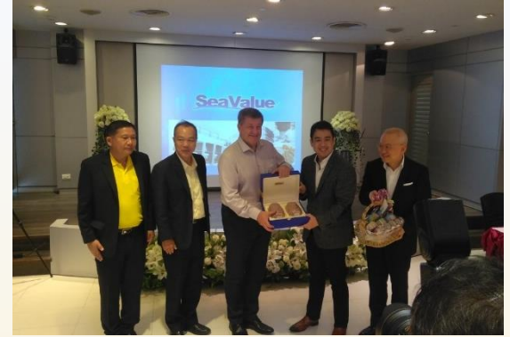
23 กรกฎาคม 2562 TTIA เดินทางเข้าเยี่ยม บมจ.ยูนิคอร์น จ.สมุทรสาคร กับ คณะ ILO นำเสนอด้านแรงงานของบริษัทฯ