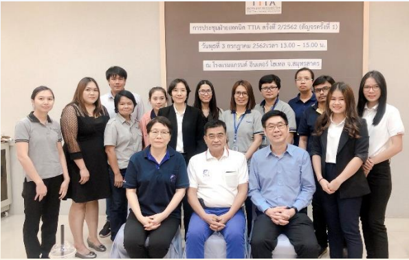
3 กรกฎาคม 2562 TTIA จัดประชุมฝ่ายเทคนิค TTIA ครั้งที่ 2/2562 (สัญจรครั้งที่ 1) ณ โรงแรมแกรนด์ อินเตอร์ จ.สมุทรสาคร